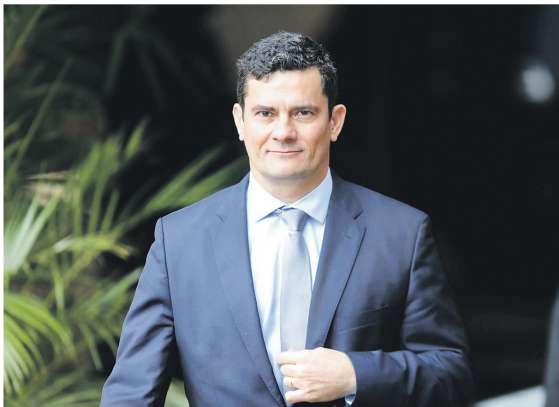
O ex-juiz da Operação Lava Jato pautou seu discurso para se eleger no combate a corrupção

O segundo mais votado no Paraná foi o Paulo Martins (PL) com 29,12%, somando 1.697.962 dos votos, contrariando as pesquisas eleitorais que mostravam a disputa apenas entre Moro e Dias. Martins foi o candidato de Jair Bolsonaro (PL) e do governador reeleito, Ra-